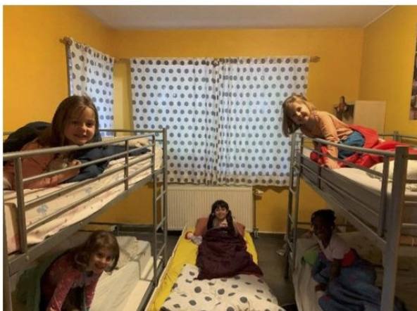
Le Petit Sainte Jeanne n°24 - juillet 2023