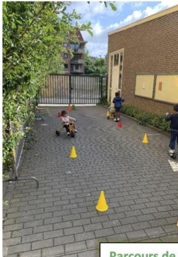
Parcours de trottinettes