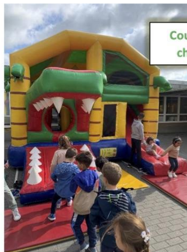
Course relais dans le château gonflable