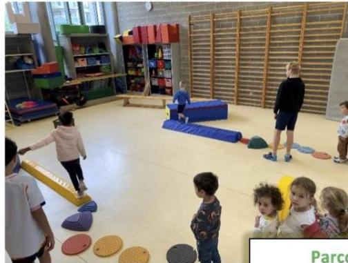
Parcours de psychomotricité