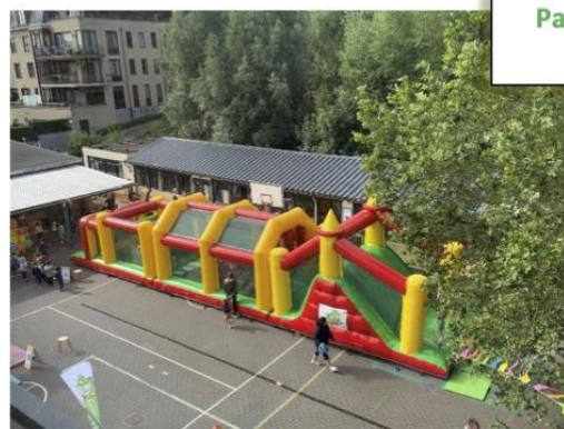
Parcours d'obstacles gonflable