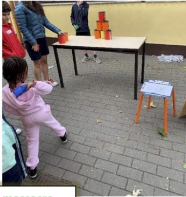
Jeu de massacre