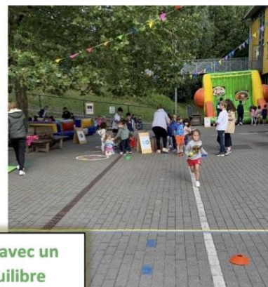
Course relais avec un objet en équilibre