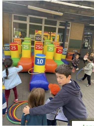
Lancer de précision