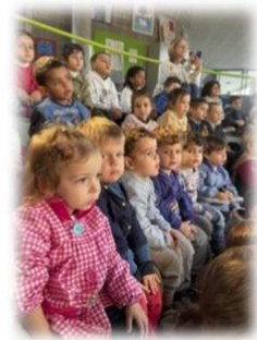
L'équipe maternelle !

C'était un conte rempli de joie, de chansons, d'humour et de partage.